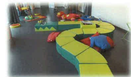
Bibliothèque municipale (jeux prêtés par la médiathèque départementale)