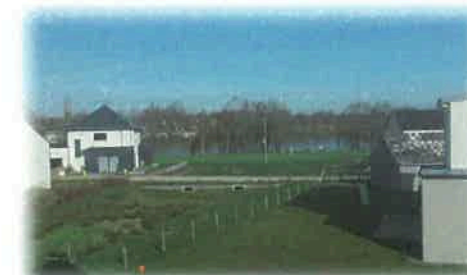
Le lotissement Les Lavandières (vu depuis les logements locatifs)