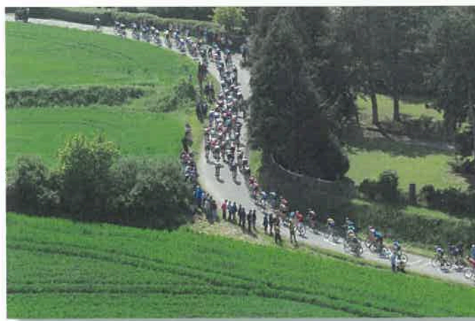
Tous à Boisgervilly le 29 avril après-midi pour ce grand moment de sport et de convivialité...

Le Tour de Bretagne, véritable rampe de lancement vers le cyclisme professionnel, fera étape à Boisgervilly le 29 Avril 2020 . Parti de Châteaubriant le même jour à 11h15, les coureurs arriveront sur le circuit final de Boisgervilly vers 15h15 ; il restera environ 45 km à couvrir sur le circuit de 9,7 km. Christophe FOSSANI, président du Tour de Bretagne précise que l'étape de Boisgervilly est la plus longue jamais tracée depuis la création de l'épreuve en 1967. Il ajoute que cette étape pourrait être piègeuse avec des routes exposées au vent, un relief mouvementé à partir de Paimpont et de nombreux changements de direction. Le Tour de Bretagne se déroulera du 25 avril au 1 er mai avec la participation de vingt-cinq équipes professionnelles françaises et étrangères de 1 ère Division amateur (DN1). L'arrivée sera jugée face à la mairie, où un sprint pour le classement par points sera également jugé dans l'avant-dernier tour de circuit. Bernard HINAULT, qui s'occupe des Relations Publiques sur le Tour de Bretagne orchestrera la cérémonie protocolaire un quart d'heure environ après l'arrivée de l'étape. Le lendemain, Quédillac accueillera le départ de la 6 ème étape où le peloton se dirigera vers Fougères.